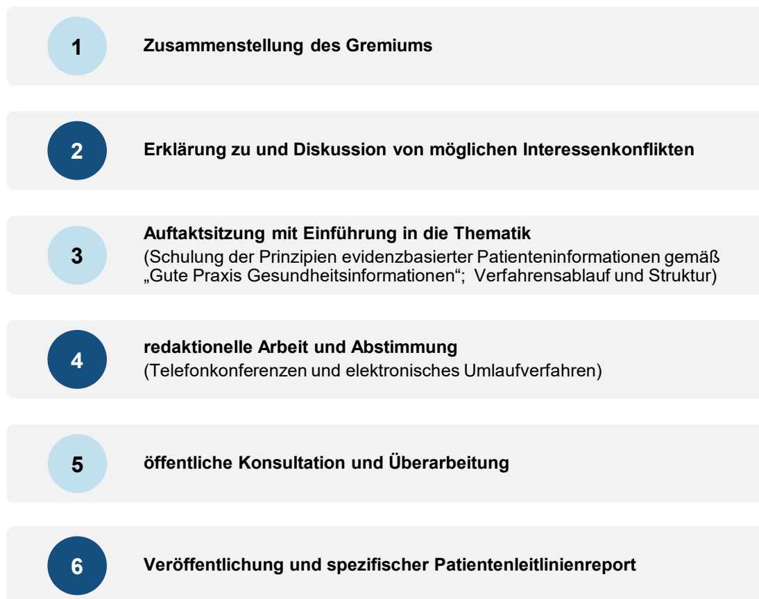
Abbildung 1: Allgemeines Vorgehen bei der Erstellung von Patientenleitlinien aus dem NVL-Programm

Einen Überblick über die einzelnen Schritte bietet das nachfolgende Ablaufschema (Abbildung 1). Die Vorgehensweise bei der Aktualisierung einer Patientenleitlinie kann davon gegebenenfalls abweichen.